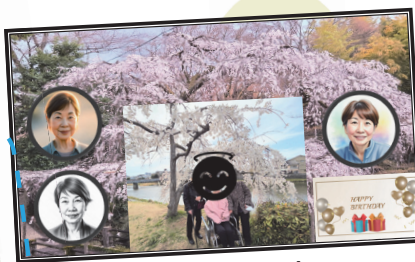
フォトシート (2025年度)